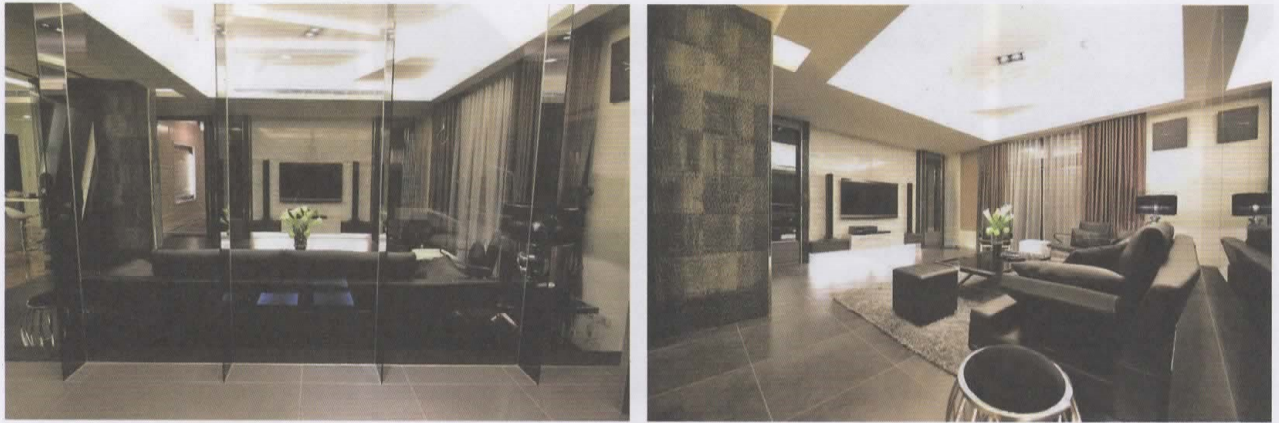
圖。燈光造型特殊，不但不會造成不便，反而將客廳整體的現代感提升，更加有趣。