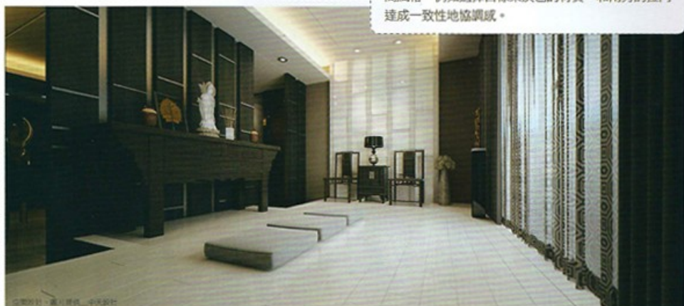
空間設計、風水諮詢、中興設計

佛堂建議配置於有正對窗的最高樓層，以表示對神明的尊敬之意，而神桌也能藉由材質來呼應整體空間風格，例如選擇白橡木染灰色的材質，和兩旁的拉門達成一致性地協調感。